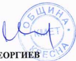
НИКОЛАЙ ГЕОРГИЕВ кмет на община Кресна